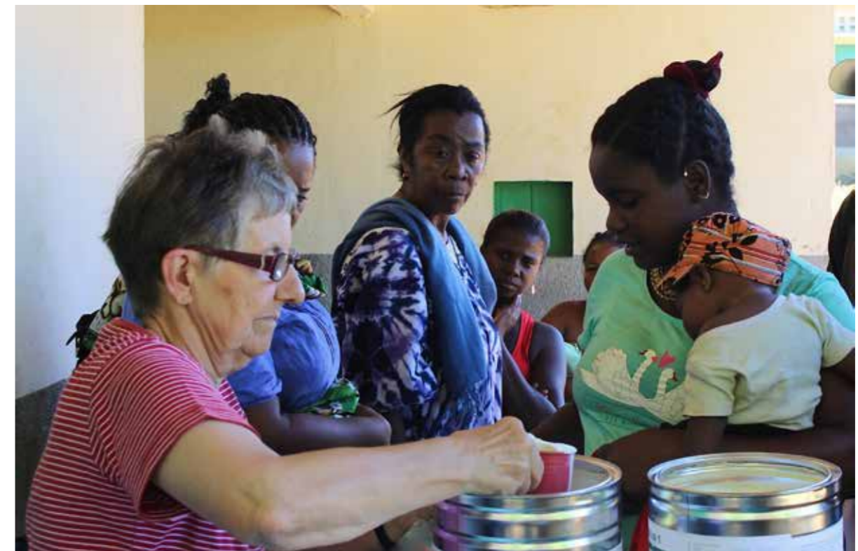
Distribution de lait en brousse