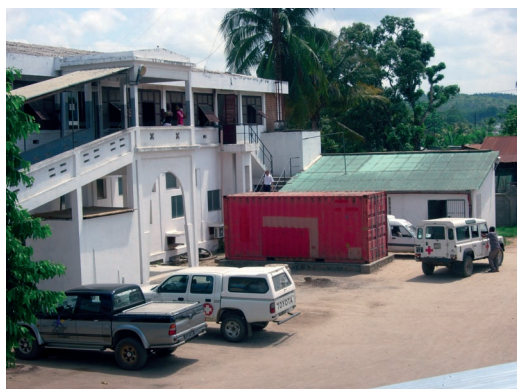
Arrivée d'un conteneur à Saint-Damien