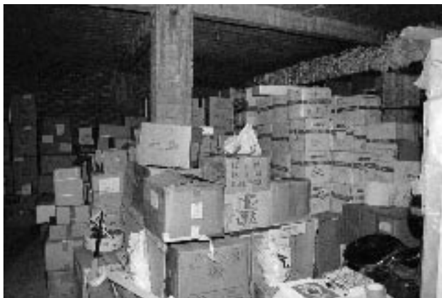
Les marchandises sont entreposées.