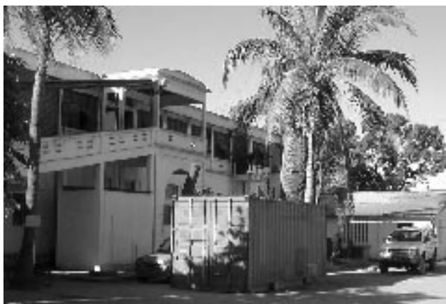
Arrivée du conteneur devant Saint-Damien