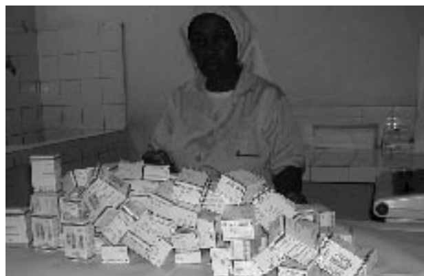
Les médicaments venus de Suisse sont rangés dans la pharmacie.